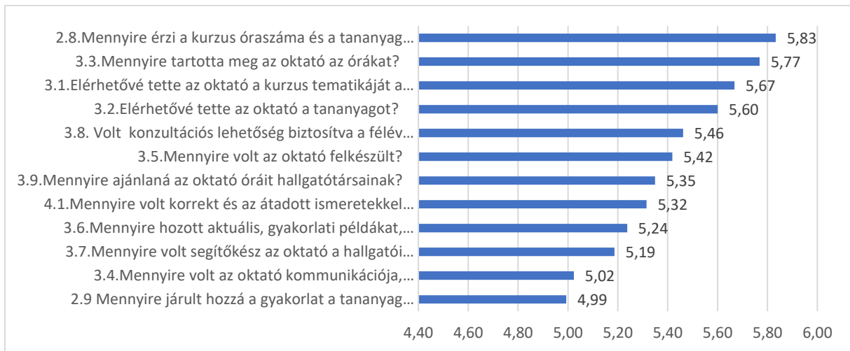
1. ábra: Minőségi mutatók értékelése (6 fokú skálás kérdések esetében)

hatos skálán 5 felett teljesített. Erősebb minőségi mutatók a kurzus óraszámára és tananyag elsajátíthatósága közötti összhang, oktatói órátartás és a kurzus tematikájának közzététele.